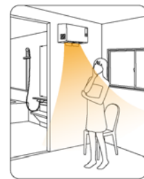
脱衣室にも暖房乾燥機を