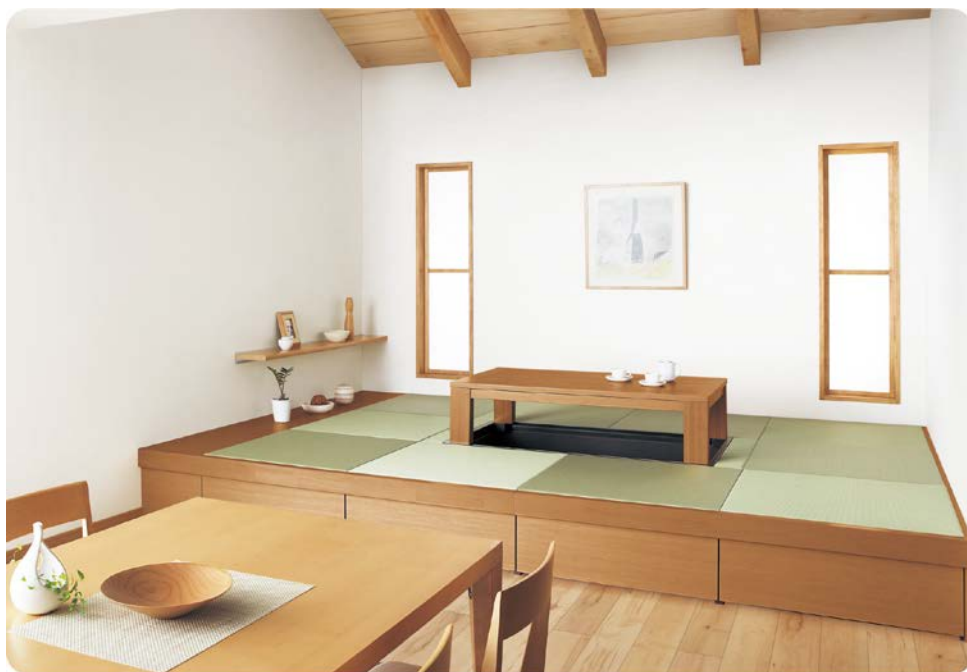
畳の感触と香りが気持ちよく、くつろがせてくれます。