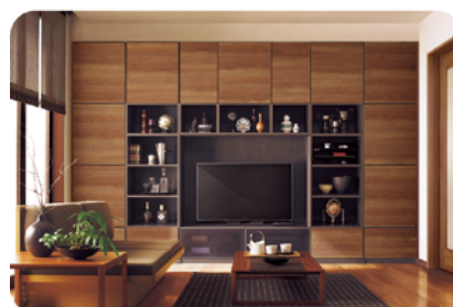
配線がゴチャゴチャ しがちな家電も スッキリ収納できます。