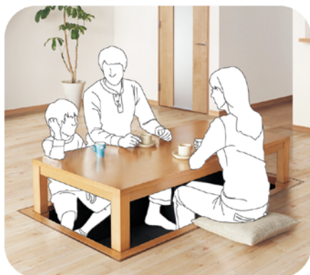
普段は足を下せる座卓。冬は掘炬燵にと、 一年中使えます。