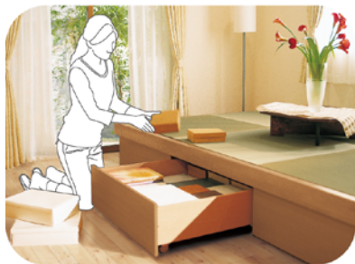
小上がりの 畳コーナーにすれば 段差を収納スペースに 利用できます。