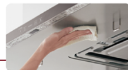
ふだんのお手入れは継ぎ目の 少ない表面をサッと拭くだけ。

※1.ラクウォッシュプレートは年1回のお手入れ が必要です。使用状況によりお手入れ頻度 は変わります。10年程度お使いで風量が 落ちたり騒音が大きくなったと感じた場合は、 ファンの交換を当社修理ご相談窓口へ依頼 してください。(有償)