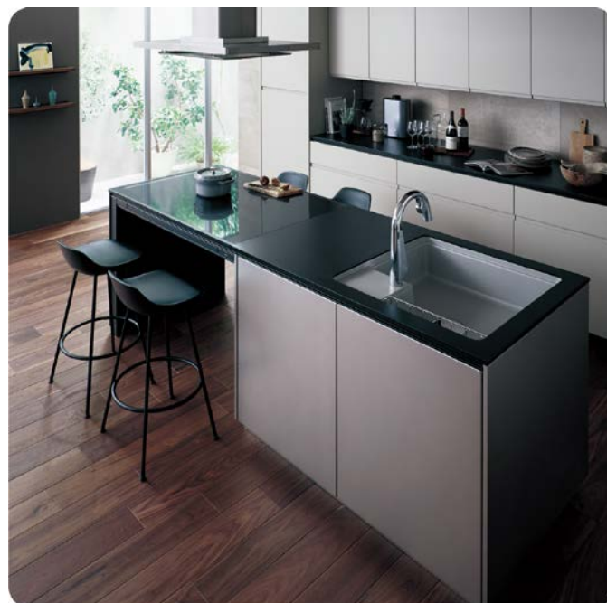
コンロの下がオープンなので椅子を置いてもじゃまになりません。

4つのコンロで同時に 調理ができるので、 煮たり焼いたり、 レパートリーが 広がります。