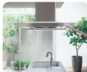
使うたびにファンが自動で油汚れを 吹き飛ばすから、おそうじは10年に 一度※1で済みます。

レンジフードの下でも会話をさまたげない静けさです。 また、ファンのお手入れは10年間不要。