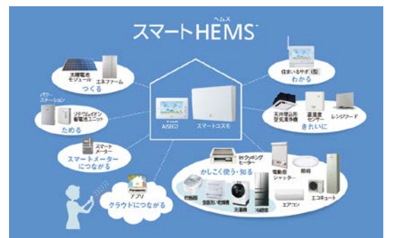
家中の電気を「見える化」でき、 節電意識をアップ。スマート HEMS