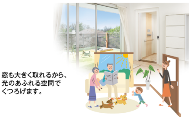
窓も大きく取れるから、 光のあふれる空間で くつろげます。

日当たりや風通しの良い2階はくつろぐのに ふさわしいスペース。集まって食事をしたり、 おしゃべりをして楽しめます。