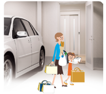
たくさんの買い物も、ガレージから 2階へラクに運べます。