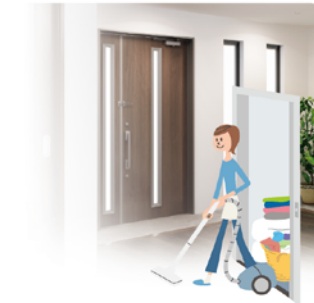
1階から2階の掃除も 部屋を回る手軽さです。

足腰が弱ると2階への移動が たいへんに。エレベーターが あれば平屋感覚で洗濯物や 買い物もラクに運べます。 階段での転倒などの危険も 減らせます。