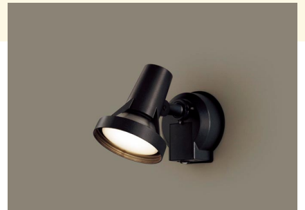
光や音による警告で、防犯対策に活躍。 リモコンFreePa フラッシュ・アラーム