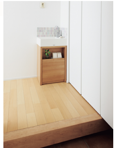
玄関のこんな一角にも洗面コーナーが。