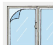
ドアや窓にガラス飛散防止 フィルムを貼る。

詳しくは政府や自治体のサイトなどご確認ください。…(一例) 政府広報オンライン https://www.gov-online.go.jp/useful/article/201108/6.html#anc02