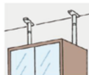
ネジ止めしにくい場所は、 つっぱり棒で固定。