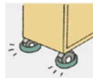
キャスターに下脚を置いて 家具の移動を防止。