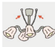
吊り下げ照明器具は チェーンで結ぶ。