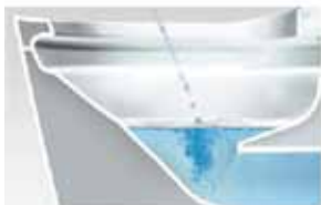
洗剤の泡がクッションになって トビハネを抑えるから床が汚れにくい