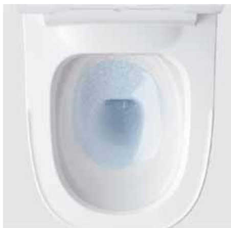
水アカと汚れのつきにくいスゴピカ素材で ツルンとキレイなトイレをキープ