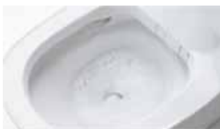
洗剤の泡と勢いのある水流で 流すたびに便器内をしっかりとそうじ

いまどきのトイレは自動で洗浄・汚れをガードし、ニオイもスッキリ。毎日おそうじしなくても、清潔感を保ちます。