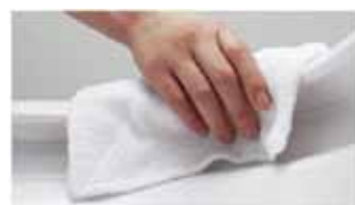
スキマや段差がほとんどないので ふき掃除がラクラク