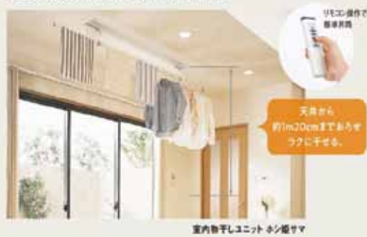
室内物干しユニット キン姫さま

天井から竿をサッとおろせて、干した後もサッとしまえる室内物干しで、花粉の時期や天候の悪い日でもラクに干すことができます。