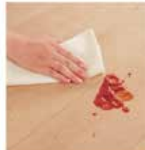
アーキスベックペリテイス