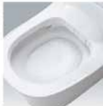
全自動おそうじトイレ