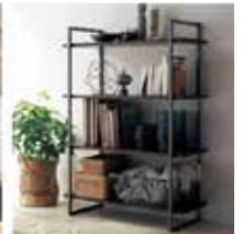
フレームシェルフ