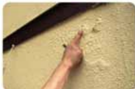
外壁の浮きやハガレをチェック。