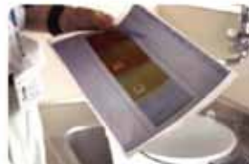
水回りの錆、作動状況をチェック。