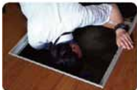
目の届きにくい場所もチェック

戸建てで最大17項目 97箇所、見えないところまで細かく建築士がチェック。「被災しやすい災害」に備えるためにも、一度プロの目で点検しませんか?