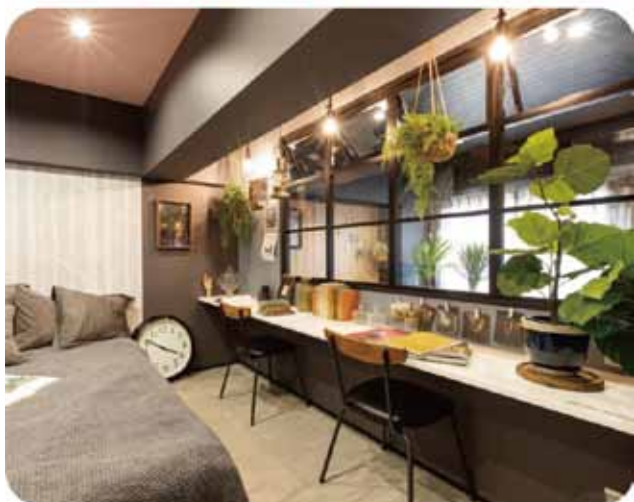
リビングや寝室など、あちこちに植物を飾ってみましょう。 窓枠や壁にフックを付けて上から飾るのもステキです！