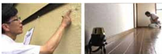
専用器具等を使って、綿密に診断します。