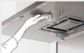
全自動おそうじファン付 ※3 ほっとクリーンフード

※1 10年間使用してもファンの汚れは当社従来品(S73A423P2)の1/10以下に抑えられた設計。 一般財団法人ベターリビング普及住宅部品質基準委員会との共同実証試験での結果。 ※2 10年使用相当の汚れ付着での基準性能試験の結果(当社調べ)。 ※3 ファンは10年に1回、プレートは1年に1回のお手入れが必要で、使用状況によりお手入れ頻度は変わります。