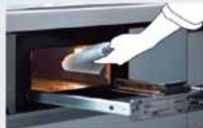
IH&遠赤ラッキンググリル