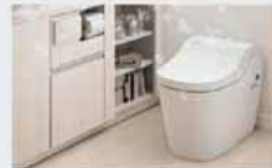
アラウーノL150シリーズ

泡で洗って、除菌 ※1 、消臭 ※2 まで全自動だから汚れにくいだけでなく、ニオイもキレイ。